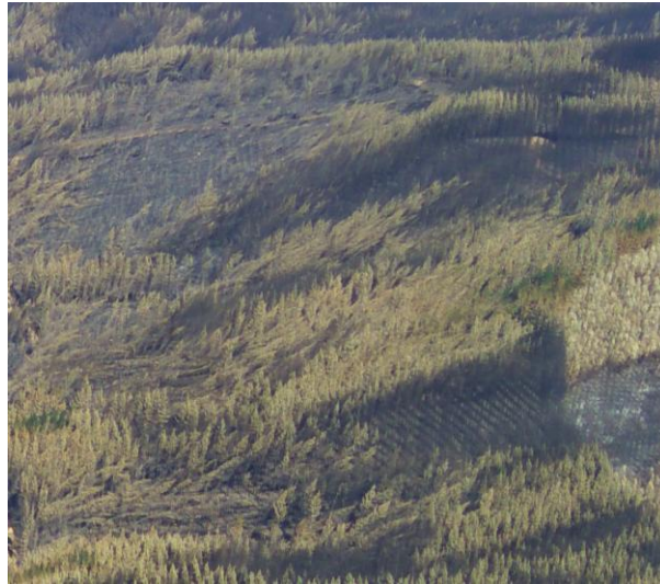
Figura 2. Detalle de rodales de plantación de P. radiata en el complejo de incendios de San Antonio (Biobío) doblados y tronchados por las corrientes de viento de succión hacia la célula convectiva.