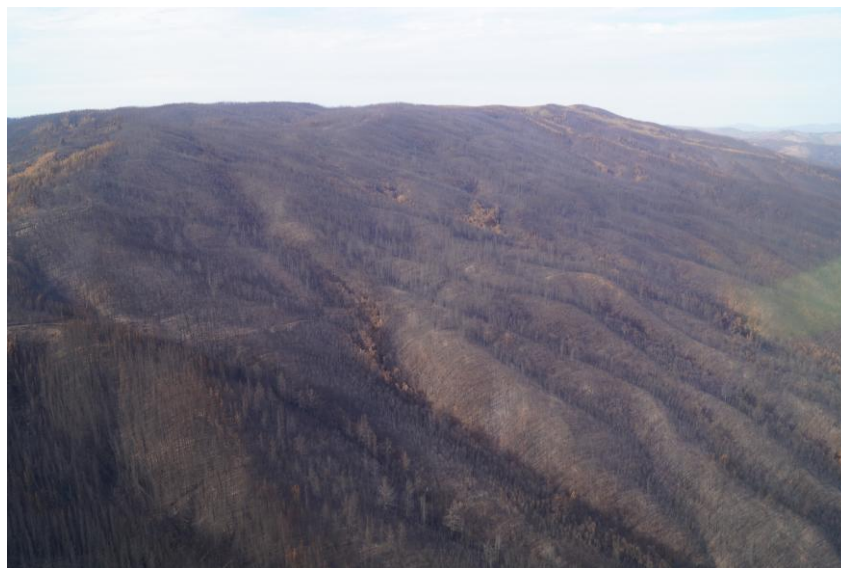
Figura 4. Detalle de la carrera de fuego más grande observada en el complejo de incendios de Las Máquinas. Su anchura supera los 2 km.