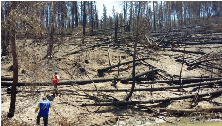
Figura 3. Rodal de plantación de P. radiata descalzado por efecto de las corrientes de viento convectivas en el complejo de incendios de Las Máquinas.